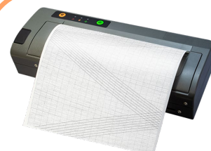
サーマルプリンタ DP-581H