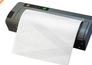
サーマルプリンタ DP-581H