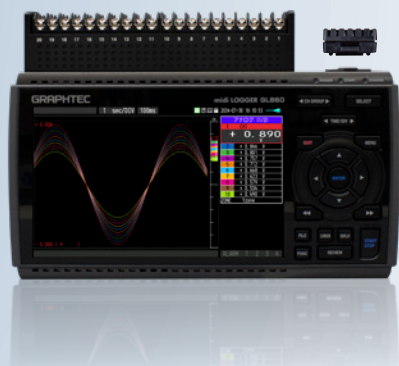
midi LOGGER GL860

無線 LAN 圏内でスマートデバイスを使用してデータの確認を行うための接続方法です。