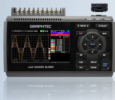
midi LOGGER GL260

遠隔でスマートデバイスや PC を使用して メールの確認を行うための接続方法です。